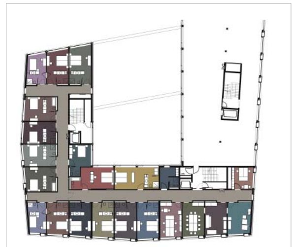
Korridorfluchten werden durch eine Abfolge von «Lichtinseln» gegliedert, den geräumigen Zimmern verhelfen farbige Decken zu einer individuellen Raumstimmung.

findbarkeit wurde eine sehr grosse Beschriftung der Türen vorgenommen. Was der Wunsch nach Eigenständigkeit der einzelnen Zimmer betraf, so machten die Architekten den Vorschlag, anstatt verschiedenartige Möbelstücke in die Zimmer zu stellen doch einfach die Bodenbeläge farblich auszugestalten. Dieser Vorschlag wurde sehr gut angenommen, jedoch hat sich in der Weiterbearbeitung gezeigt, dass die dafür in Frage kommenden gegossenen Kunststoff-Bodenbeläge für einen Hotelbetrieb nicht geeignet sind. Man hat deshalb die Idee der farbigen Bodenbeläge im wahrsten Sinn des Wortes auf den Kopf gestellt und stattdessen für jedes Zimmer eine farbige Decke vorgeschlagen. Dieses Konzept war sogar noch passender für ein Hotel, da die Gäste nun auf den Betten liegend die Farbe der Decke anschauen können. Die Findung der einzelnen Farben hat das Gestaltungsteam eine ganze Weile lang beschäftigt, denn das Ziel bestand darin, die Farbkombinationen über alle Zimmer betrachtet bewusst aus-